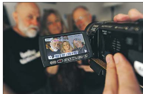
Videokameraet - et uundværligt arbejdsredskab.