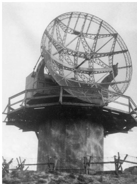
Hanstholm: »Würzburg Riese«-radar på lavt beton-tårn.

Foruden 38 cm batteriet var der 17 cm batterier, både som standpladser og indbygget i bunkers. Der var bunkers for kommandocentralen, ammunitionsdepoter, el-værk med maskincentral og beskyttelsesrum.