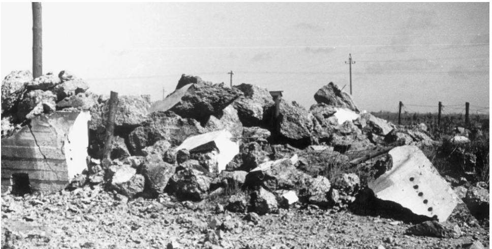
Thisted. Sprængt pansermur, maj 1945.

Det var nødvendigt at sprænge den væk, men da muren lå i tæt bebygget område, måtte der bruges små indborede ladninger, for at sprængstykker ikke skulle ødelægge