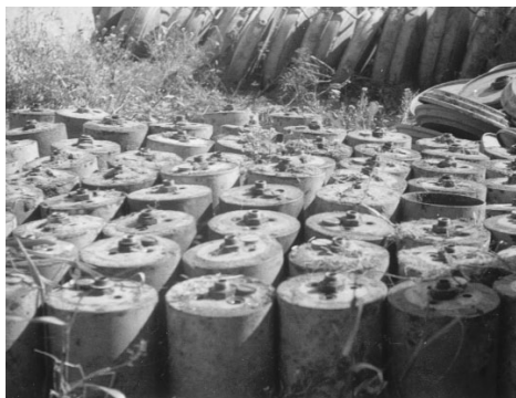
Thisted. Lager af miner, som anvendtes ved sprængninger.