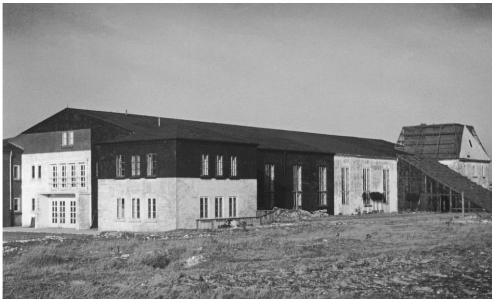
Hanstholm. Marinehalle, set fra sydøst.

også mennesker, og de opførte sig egentlig meget pænt, og folk måtte jo arbejde for tyskerne for at overleve, for der var ingen understøttelse til dem, som nægtede det. Mit eget indtryk af de tyske soldater, som jeg kom i forbindelse med, var, at de var høflige, hjælpsomme og lette at samarbejde med.