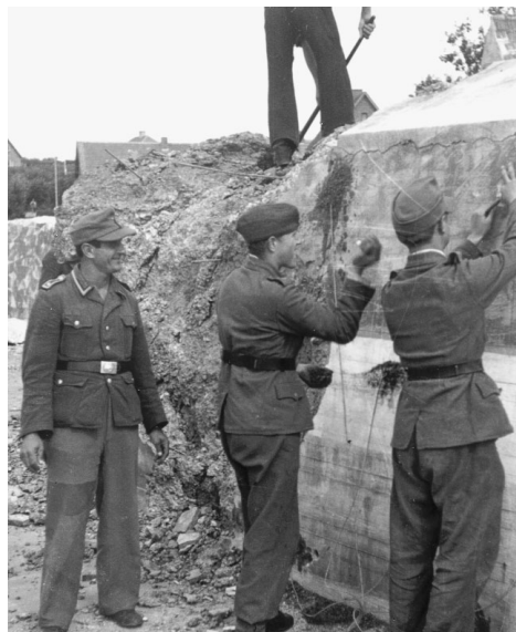
Thisted. Tyske minører forbereder sprængning af pansermur, maj 1945.

Det var meget interessant at leve sig ind i forholdene i denne del af landet i tiden